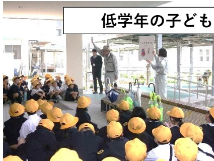
低学年の子どもたち