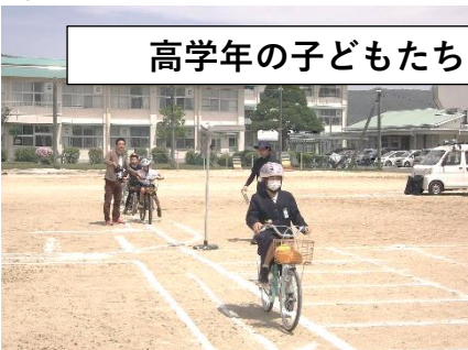
高学年の子どもたち

中学年以上は、自転車の乗り方やルールについて学びました。グラウンドに練習のための信号機や横断歩道が準備され、そのコース内で注意する点などを意識しながら活動しました。