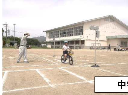
中学年の子どもたち