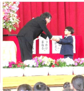
防犯ブザーの贈呈