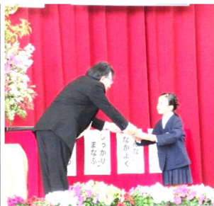
教科用図書の給与