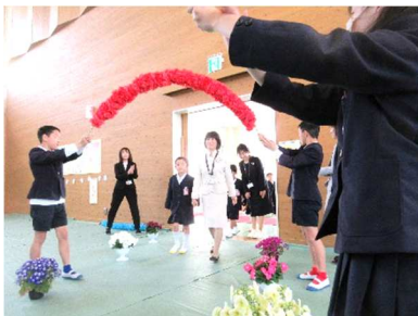
新1年生の入場の様子

学年に関わらず、全教職員で新1年生の指導に当たりますので、よろしくお願いいたします。