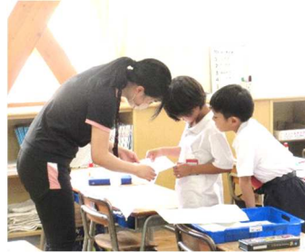
困っている子どもに寄り添う