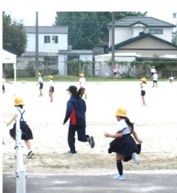
子どもと元気よく遊ぶ