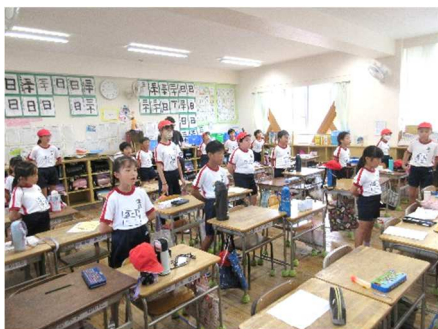
21日 雨のため教室で応援練習

連休明けにインフルエンザによるお休みがぐんと増えましたが、多くの子どもたちは体調がよくなれば22日か23日からは登校できるとのことです。また、今週は全般的に雨模様ですが、何とか運動場での練習もできています。(おかげさまで日中の気温はそこまで上がりず、熱中症についてとても心配する状況ではないようです。湿度が高いので注意はしています。) 本日予定の総練習は休んでいる児童にも配慮して23日に延期しました。