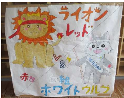
赤組マスコットと白組マスコット