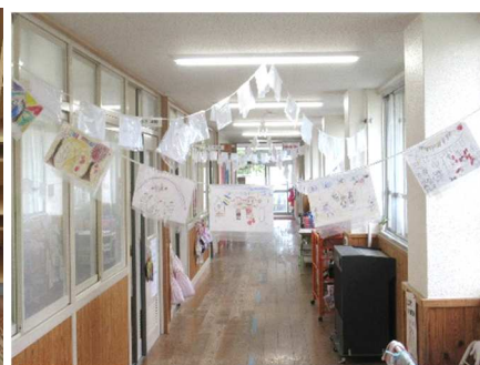
1年生教室廊下前の手作り万国旗

いくつかの練習不足は否めませんが、金立小学校の子どもたちが全集中で本気の力を発揮してくれることと思っています。9月24日(日)の運動会にできるだけ万全の状態での臨んでほしいと思っています。