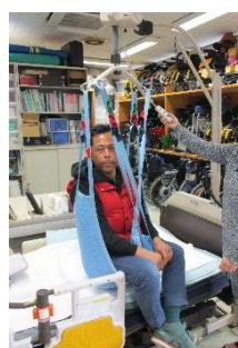
リフトでベッド移乗