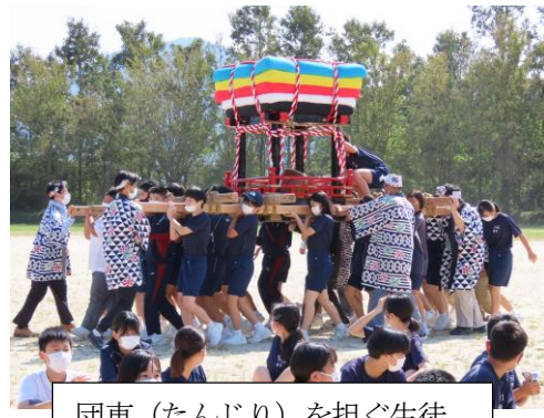
団車（たんじり）を担ぐ生徒