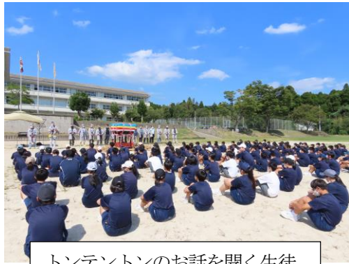
トンテントンの話を聞く生徒