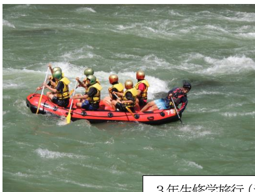
3年生修学旅行（ラフティング・熊本城）

同日に2年生は職場体験、1年生は郷土学習で校外活動を行いました。どの学年の取り組みも地域の方々のたくさんの協力を受けながら充実した活動になりました。職場体験で生徒を受け入れていただいた事業所の皆様や、郷土学習で1年生に講話をしていただいた皆様に心から感謝申し上げます。