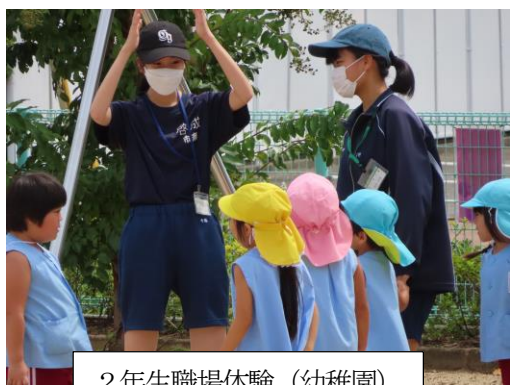
2年生職場体験（幼稚園）