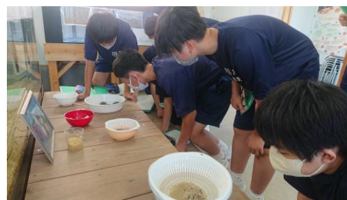
1年生郷土学習（カブトガニ）