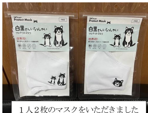
1人2枚のマスクをいただきました