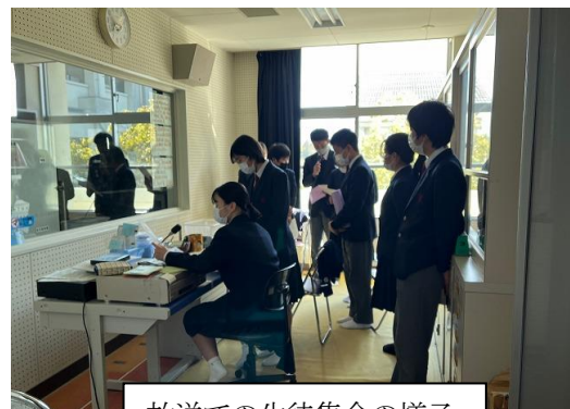
放送での生徒集会の様子

3月2日（水）に生徒集会を行いました。今年度、体育館に集まっての生徒集会は12月に行った集会のみで、今回も残念ながら放送での集会となりました。本当は集会の度に全校で歌を歌い、音楽を通して互いの絆を深めたいと思っておりますが、今の状況下ではなかなか実現できない状態です。そんな中ではありますが、新生徒会のメンバーは頼もしく活動してくれています。この日の生徒集会では、総務、文化、図書、保体、環境の各委員長が、2月の取り組みの反省や3月の目標などを放送で全校生徒に伝えてくれました。あと一月もすると、今の2年生は最上級生となります。いよいよ本格的な生徒会活動が始まりますが、いろいろな場面で全校を引っ張り活躍してくれることと思います。