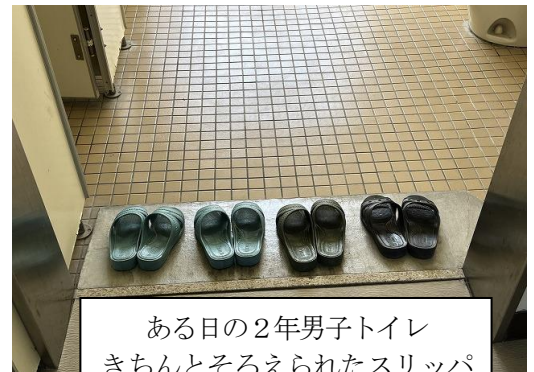
ある日の2年男子トイレ きちんとそろえられたスリッパ はとても気持ちいいものです。

来年度も、生徒が「学校が楽しい」と思えるような学校づくりをしていきたいと思います。今後ご理解とご協力のほどをよろしくお願いします。