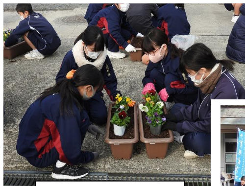
プランターへの花植え

プランターにパンジーなどの花を植えたり、コミュニティセンターの敷地内を掃除したりするなど、休日にもかかわらずたくさんの生徒が熱心に活動してくれ、地域の方も喜んでおられました。最後はポップコーンや綿菓子をいただき、生徒たちにとっても充実した時間になったようです。