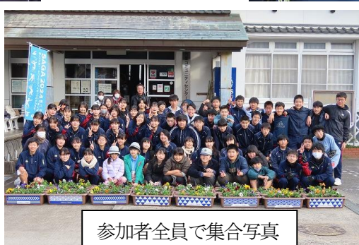
参加者全員で集合写真