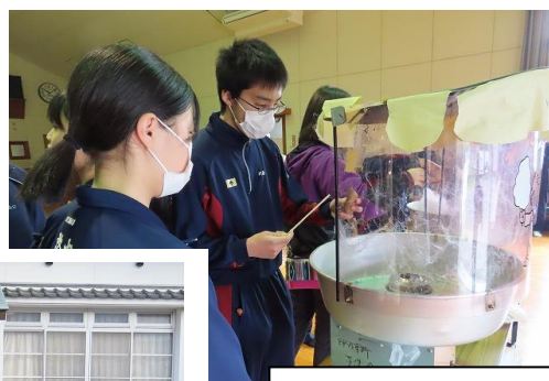
綿菓子づくりに挑戦