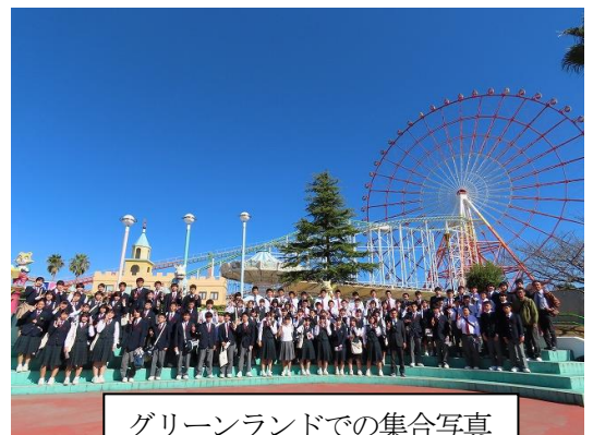
グリーンランドでの集合写真

今年度も残すところあと3ヶ月。特に3月11日（金）に卒業を迎える3年生にとっては残り少ない日々となりました。オミクロン株の発生などコロナの状況はまだまだ収束には至りませんが、限られた啓成中学校での日々を充実したものにしてくれればと思います。