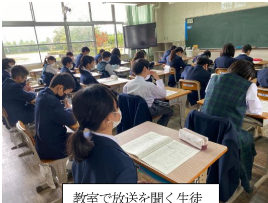
教室で放送を聞く生徒