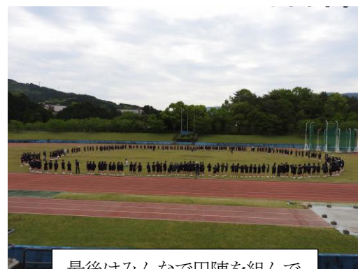
最後はみんなで円陣を組んで