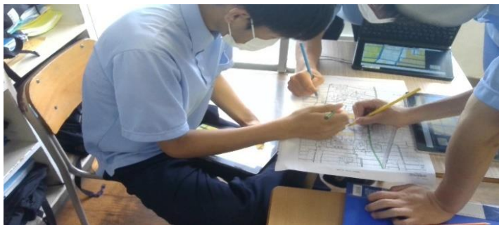
ハザードマップ作成している様子

地域のハザードマップを作成しています。講師の方を呼んで佐賀で起こる災害について知り、災害に備えるさらなるハザードマップの作成に励んでいます。よりわかりやすいハザードマップを作成していきます。