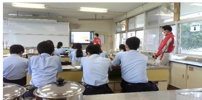
講師の方の話を聞いている様子