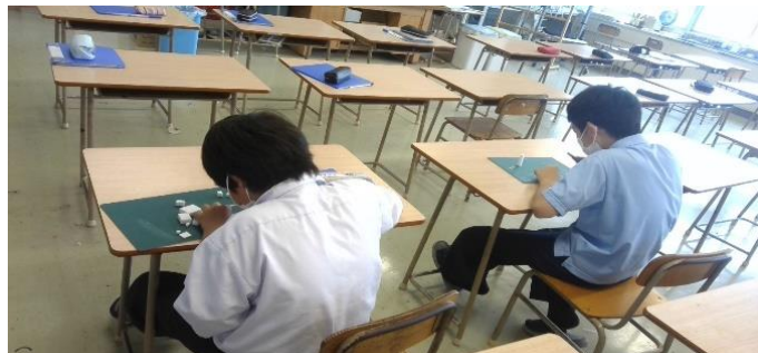
消しゴムをカットしている様子

これから学習に生かすために、「防災」「減災」に関するアンケートをお願いしています。