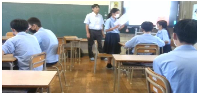
災害を想定した避難ルートを発表している様子