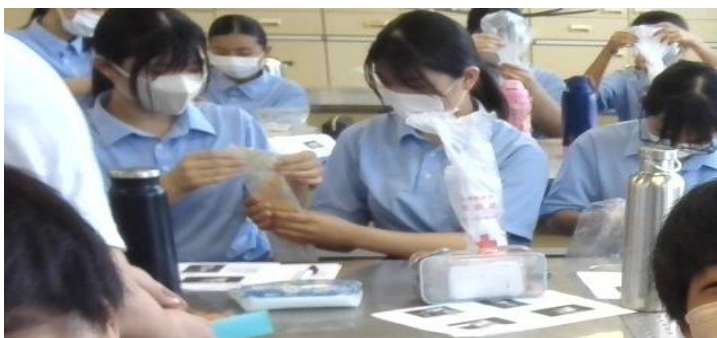
非常食を作っている様子

講師の方に話を聞いたりビニール袋でお米の非常食を作ったりと、過去の災害の経験を生かしていくための知恵を学んでいます。