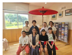
〈公民館落成式〉 〈公民館外観。遊び場もあって嬉しいね〉 〈6年生と茶道クラブ外部講師の先生方ありがとうございました〉