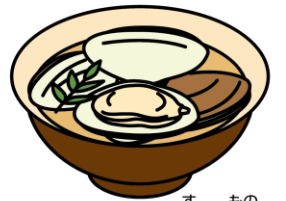
はまぐりのお吸い物

3月3日は「ひな祭り」。女の子の健やかな成長を願ってお祝いをする日本の伝統行事です。現在のように、ひな人形を飾るようになったのは江戸時代のことで、もとは人形を身代わりにして邪気をはらう「流しびな」が起源とされます。行事食として、ちらしずし、はまぐりのお吸い物、ひしもち、ひなあられなど、華やかな食べ物が並びます。