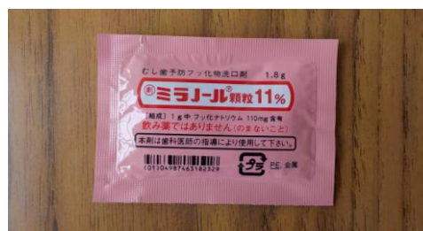
（「ミラノール」1.8g入り：10人分）