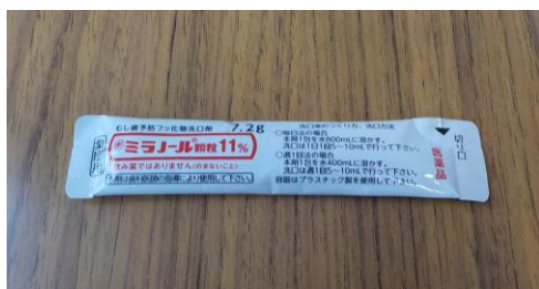
（「ミラノール」7.2g入：40人分）