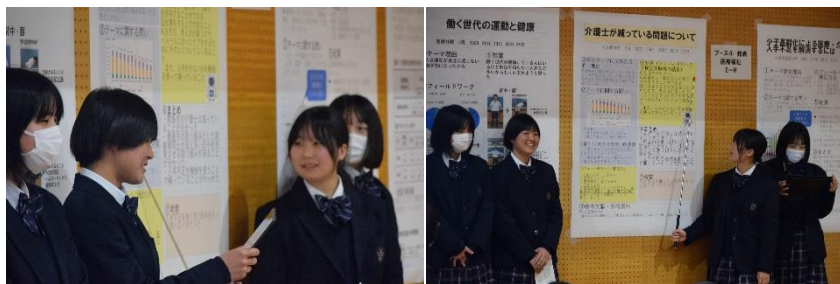
市民同士の交流機会をつくり、共助の意識を醸成するというアイデア