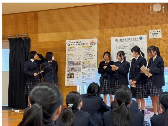
発表後の質疑応答