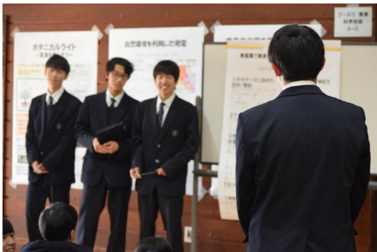
発表後の質疑応答