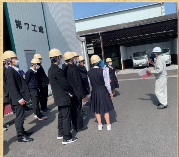
フィールドワーク前の事前授業の様子