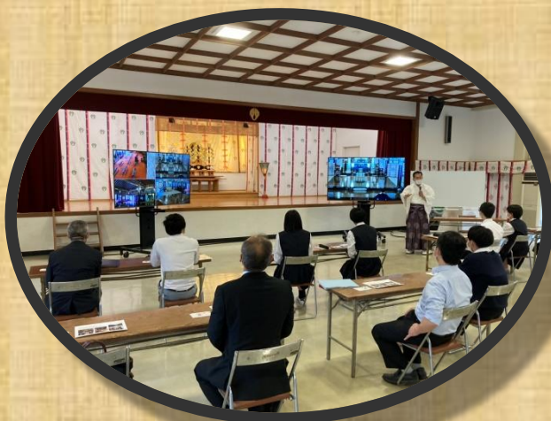
リモート参拝の様子

祐徳稲荷神社様を訪問しフィールドワークを行いました。宮司が神社の歴史や現在行っている取組について、生徒たちへ丁寧にお話をしてくださいました。内容が非常に分かりやすく、生徒たちは興味津々で聞き入っていました。コロナ禍の対策として、リモート参拝などの最先端の参拝方法などを取り入れていらっしゃいました。