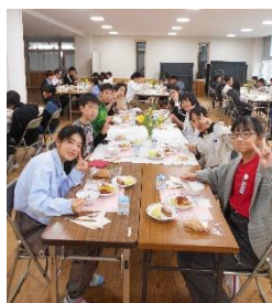
「6年生マナー給食」ごちそうをナイフとフォークで食 べました！テーブルに飾られた花も素敵でした。