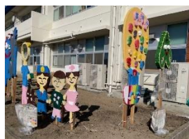
4年生力作のかかしたちが、学 校でみんなを見守っています！