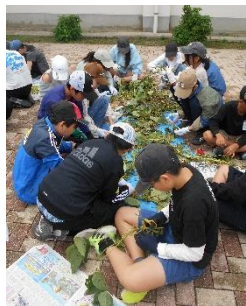
ひと房ずつ枝豆の収穫。 全校給食で味わいました！