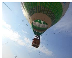
バルーン係留で搭乗体験