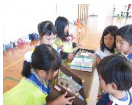
「1・2年生かせっ子まつり」 はっぴ姿で雰囲気もばっちり！