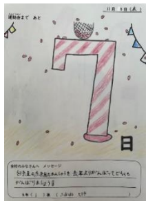
「運動会カウントダウン！ カレンダー！」 手描きの温かみが素敵です