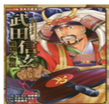
「武田 信玄」 すぎた とおる 原作

甲斐国(現在の山梨県)は、山にかこまれ、戦国時代は米が取れず、人々は飢えに苦しんでいた。戦国時代、最強の武将といわれた信玄は米の代わりに、大麦や小麦をすりつぶし麺にし、たくさんの野菜や肉とともに煮こみ、みそを入れて味をつけたものを兵士の合戦の食料としていた。徳川家康とも戦って勝ったことのある戦国最強のひけつは「ほうとう」のおかげ??