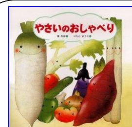
「やさいのおしゃべり」

「クククン おいしそうなおいがするなあ。」 ぐうぐう山の食いしん坊な動物たちが、においをたどって、ついたのは、おそろしい魔女がすんでいるという家の前。みんなが、こわくて、ふるえている中、ひとりで魔女の家に入ったハリネズミくんが見たものは? みんなで協力して働くといいことがおこるよ。