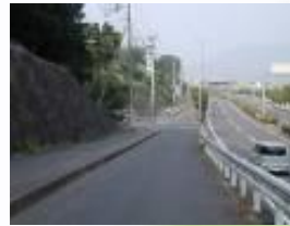
㉨春日神社前道路 不審者出没注意。