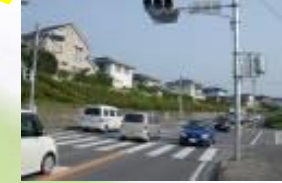
㉦双水古墳交差点 カーブで見えにくい。