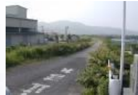
㉧松浦川沿いの道 一人は危険。