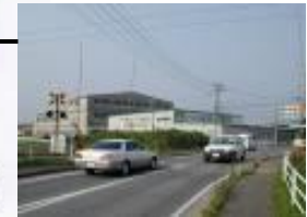
㉢通学路踏み切り 列車や線路に注意。