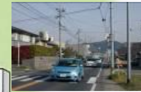
㉣山本駅への国道 お店へ出入りする車がある。 車のスピードも速い。