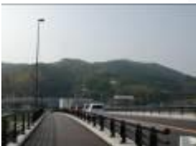
㉥川原橋交差点 歩道橋を渡る。