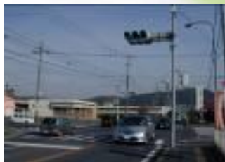
㉩ドラモリ前交差点 とても車が多い。 青信号でも気をつけて渡る。