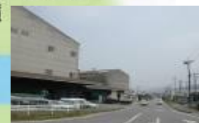
㉩コココーラ前道路 人通りが少ないので、 通学路に使わない。