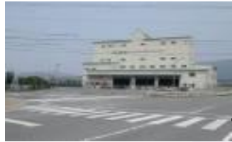
㉠学校すぐ交差点 左右確認して横断歩道を渡る。