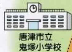
唐津市立 鬼塚小学校