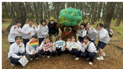
虹の松原保全活動(5月)