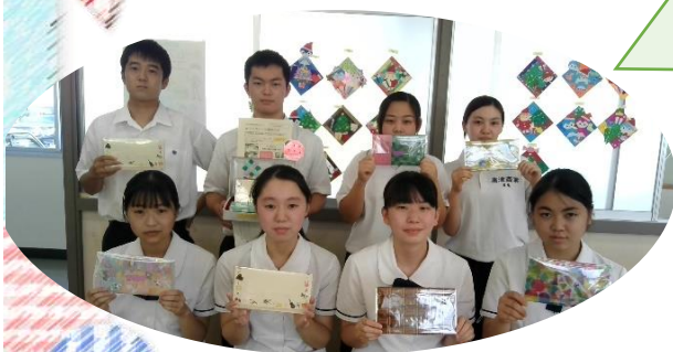
↑家庭クラブ委員の皆さん