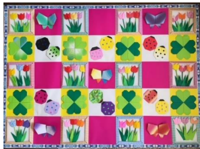
↑過去に寄贈した作品

活動内容としては「弁当作りプロジェクト」やボランティア活動を行っています。主なボランティア活動としてはマスクケース制作、古切手・インクカートリッジ回収、子ども達に折り紙で作った保育作品をプレゼントしています。マスクケースの売上金は唐津市の子どもたちの施設等に募金しています。事務室窓口で販売していますので、ご来校の際は購入にご協力ください。よろしくお願いします。