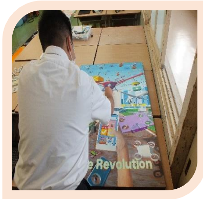
美術部の作品制作の様子