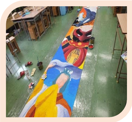
垂れ幕作成の様子

9月28日から佐賀県総合文化祭が開会されます。それに向けて本校の文化部が作品制作や垂れ幕作成に励んでいます。「みんなを笑顔にできる作品」を目標に制作に励んでいます。