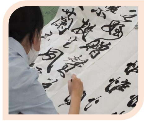
書道部の作品制作の様子