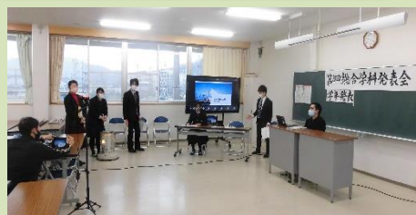
↑発表をリモートで行う会場の様子