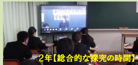
2年【総合的な探究の時間】

自分の希望する進路先について調べた情報をまとめました。「発信」が大切だと学ぶことが出来ました。