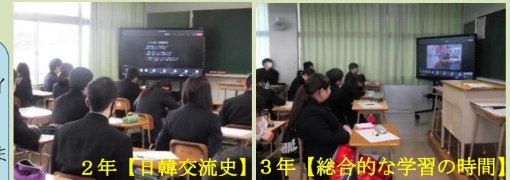
「日韓交流を通して学んだこと」「ことわざについて」「ディズニーについて」

2年生の日韓交流史では、名護屋城、唐津の遺産等の調査結果と韓国アイドルのダンスを動画で発表しました。3年生は自分で調べたいことを決めました。「ことわざ」、「ディズニー」について発表しました。