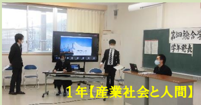
1年【産業社会と人間】