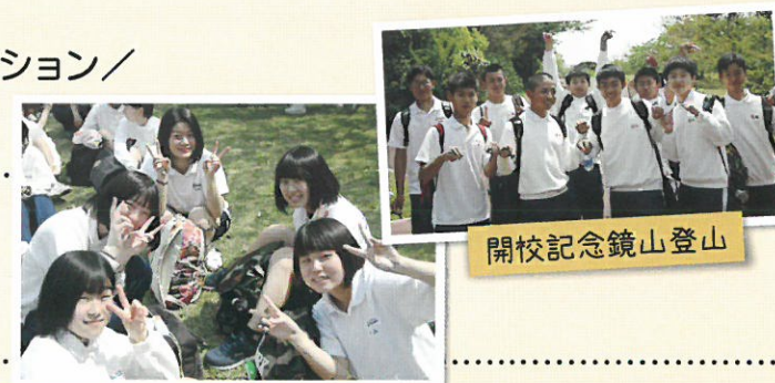
開校記念鏡山登山