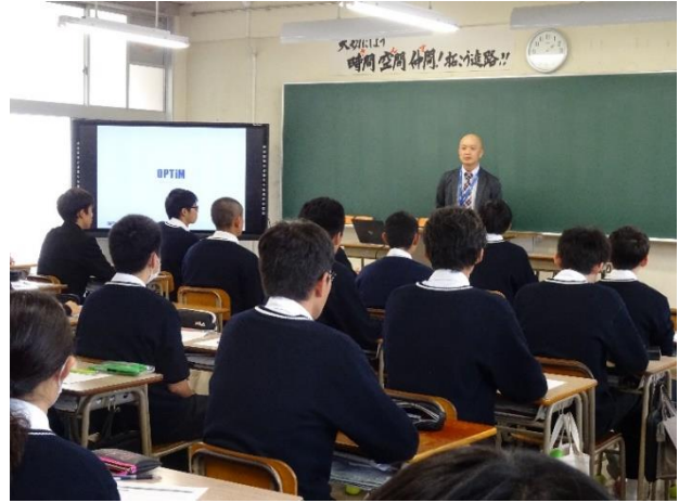
株式会社 オプティム 九州統括事業本部リーダー