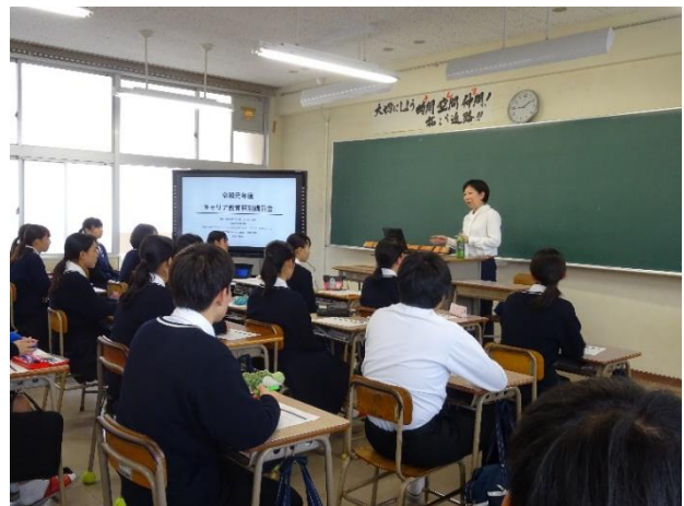
株式会社 Karatsu Style 代表取締役