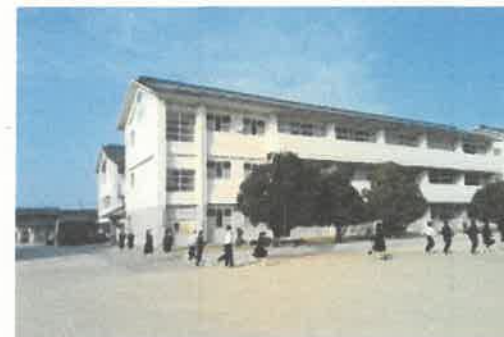
避難訓練のようす

11月10日(木)の7限目には、消火・避難訓練が実施されました。6限目終了と同時に避難訓練が始まり、中学生・高校生が6限目にいた場所からグラウンドに避難しました。