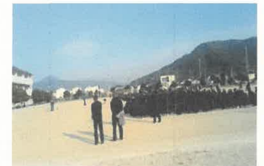
消火訓練のようす