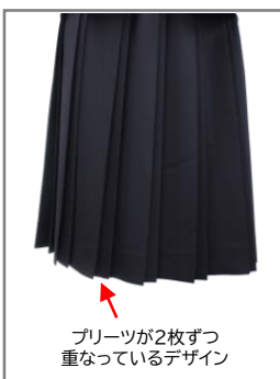
佐賀県初! Wプリーツスカート