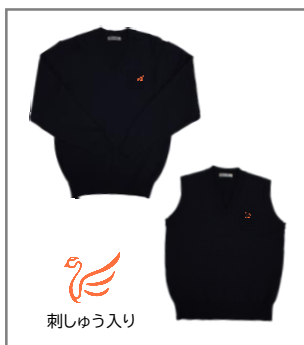
鶴マーク入り ニットセーター・ベスト