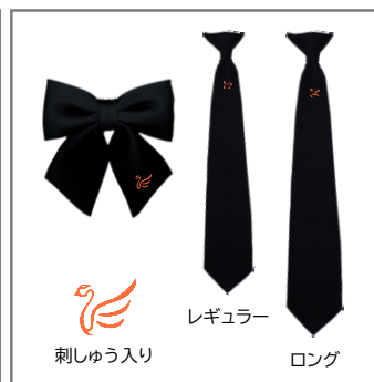
鶴マーク入り リボン・ネクタイ