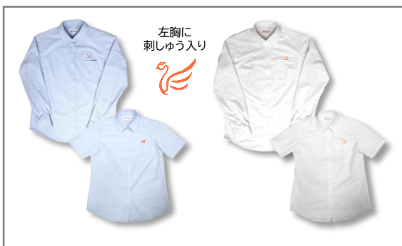
中高で色違いのシャツ (青=高等学校/白=中学校)