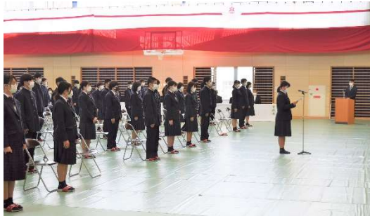
◇ 新入生代表の宣誓