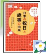
「日本の祝日と歳事の由来」