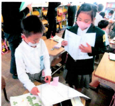
↑ 登場人物の「こころの声」を伝え合う1年生