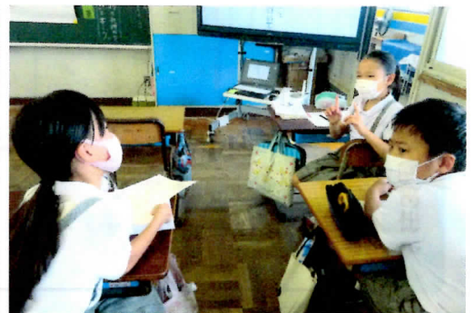
↑ 登場人物の心情について話し合う4年生