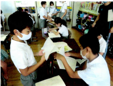
↑ 心情の変化について考えを交流し合う5年生