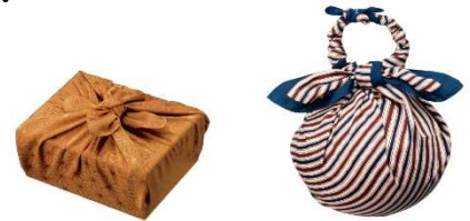
●四角い物、丸い物を包む