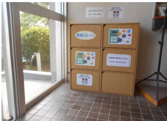
制服回収ボックス

希望されるサイズがない場合もあります。ご了承ください。 希望者が多い場合は、配布できる数を制限させていただく場合があります。