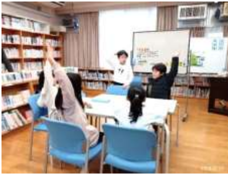
【 ゆうき会の様子 】

2/7(水)放課後は「ゆうき会」が行われ、2月の月目標とゆうき会そうじの場所を話し合いました。