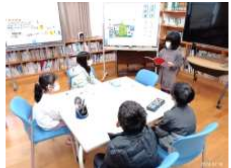
【 記念写真の様子 】

前回と今回のスピーチタイムは、「タイトル」を当日に見ており、その場で自分の考えを書きスピーチタイムに臨んでいました。臨機応変に対応できる5人はとても素晴らしかったです。