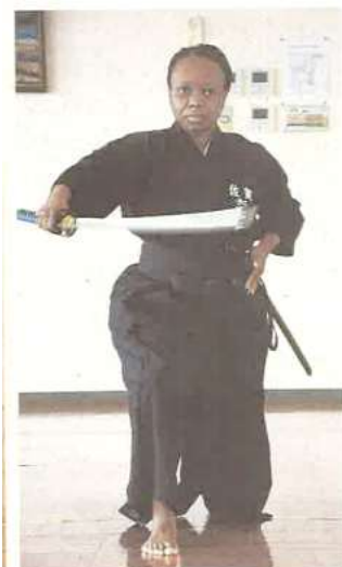
【 記事の写真 】

お仕事のお忙しい中、週 1 回稽古に励んだ成果だそうです。機会があれば本校の子どもたちにも居合道の紹介をお願いしたいと思います。