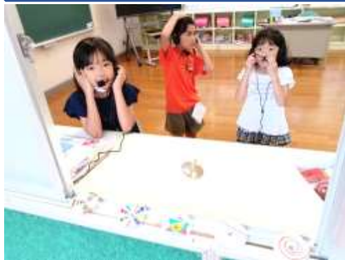
【 コマのドライブスルーの様子 】

6/22(木)朝の校門でのあいさつを終えて、職員室に戻ろうとしたら、小学2,3年生の子どもたちから、「ちょっと教室に来てください。コマのドライブスルーをしています。」と誘われました。