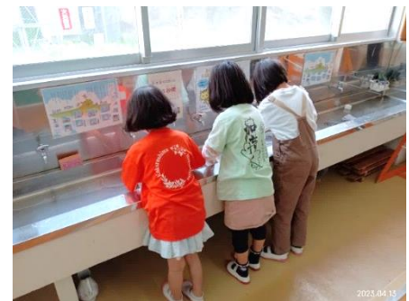
【 雑巾洗いの様子 】

一人ひとり大変だと思いますが、子どもたちと職員で協力してきれいな学校にしていきたいと思います。