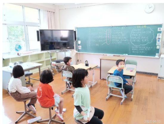
【 目標決めの様子 】

さっそく、掲示用に何色の広用紙にするのか、実際の広用紙の色を見ながら決めました。今年は、緑色の広用紙になりそうです。4/29(土)の授業参観には、完成していると思いますので、ぜひご覧ください。