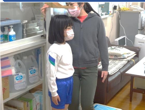
【 発育測定(身長)の様子 】