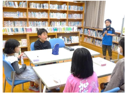
【 ゆうき会の様子 】

また、5/2(火)に行われる遠足の役割分担も話し合いで上手に決めることができました。これからも5人が力を合わせて加唐小中学校での生活を有意義なものにしてほしいと思います。