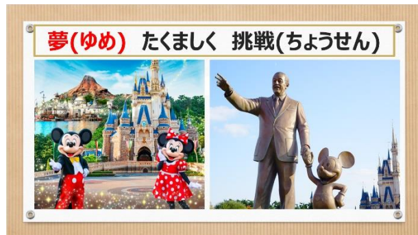
【 ミッキー・マウス と ウォルト・ディズニー 】

ご家庭におかれましても「将来の夢や目標」について、会話をしていただけたら幸いです。よろしくお願いいたします。