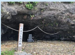
オビヤ浦 百済第25代王 武寧王 生誕地