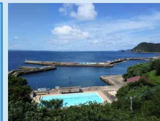
校舎からの景色 プールと港