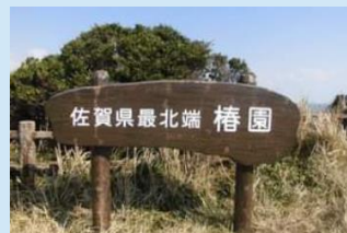
カリオ灯台 佐賀県最北端