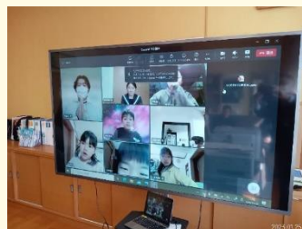
学校と自宅におけるリモート授業のモニター画面

自分の考えを「話す力」、相手の話を「聴く力」、自分の考えをもち「質問する力」、さらには、この3つの力を活用して自ら課題発見や課題解決を行うことのできる「話し合う力」からなるものである。「話し合う力」には、目的のために話し合いを行っていくという態度も含まれる。