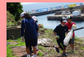
6月 加唐島島内清掃