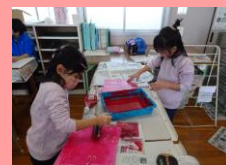
12月 版画カレンダー