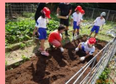
9月じゃがいも植え

Kakara Elementary School Matsusima Junior High School Branch School