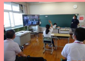
6月 気になるニュース