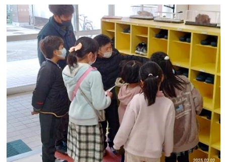
【スタンプラリーの様子】

2人の島留学生は、加唐島での生活を心待ちにしているようですので、子どもたちみんなで加唐島や松島のよさをやさしく教えてほしいと思います。