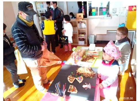
【 お店屋さん様子 】

私が到着した時には「おみせやさん」が始まっており、入口で買い物バックと手作りのお金をいただいてお店に入りました。