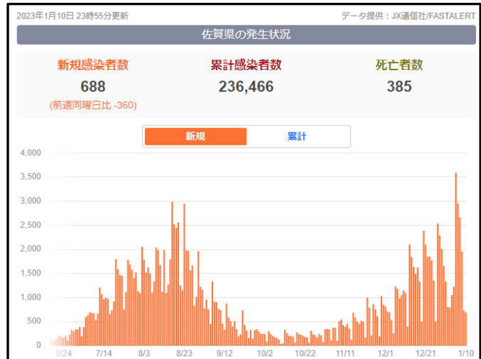
【佐賀県のコロナ感染者数の推移 1/10 現在】