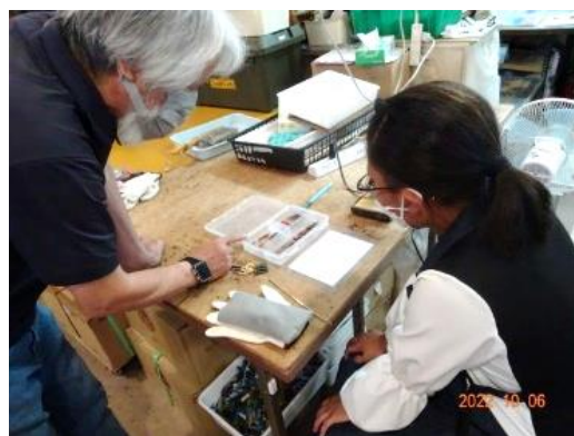
【瑠璃庵 アクセサリー制作】

「出島」は、近年、発掘作業や復元建物の整備が進み、17 世紀の街並みが復元されていました。それぞれの建物の中も当時の資料を基に復元しており、リアルな当時の様子を学ぶことができました。