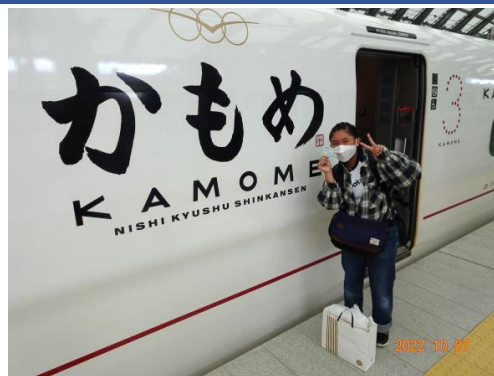
【武雄温泉駅 新幹線かもめ】

6 日(木) 1 日目は、唐津駅から乗り継ぎ、先日開業した西九州新幹線で武雄温泉駅から長崎駅まで移動しました。武雄温泉駅で「リレーかもめ」から「新幹線かもめ」に乗り換えましたが、乗車券は一つの列車として取り扱われて、1 枚の特急券に「リレーかもめ」と「新幹線かもめ」の指定席が印字されていました。20 数分の旅でしたが、広々としてきれいな座席で快適に過ごせました。