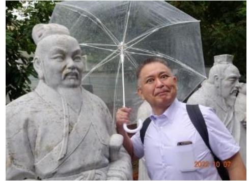
【孔子廟 児童が見つげてくれた校長先生似の賢人像】

園内を散策しながら、出島のオランダ商館が閉じられた後、貿易の開口都市となった長崎の幕末から明治にかけての歴史や文化を学ぶことができました。