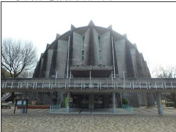
◎市村記念体育館(北正面)