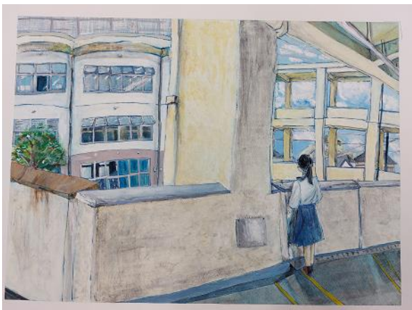
城北ギャラリー 「春の日」1年(現2年)生徒作品 (第83回全国教育美術展 全国 特選)