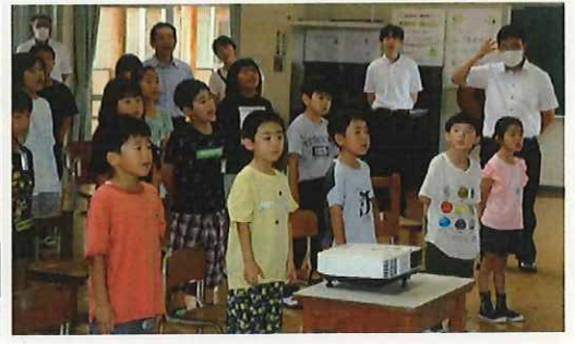
↑ 「世界中の子どもたちが」を歌いました。