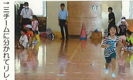
→3チームに分かれてリレー