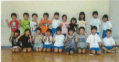
↑3校で写真を撮りました