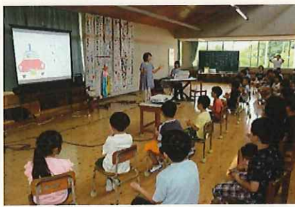
↑ 「ねこのピート」の読み聞かせ