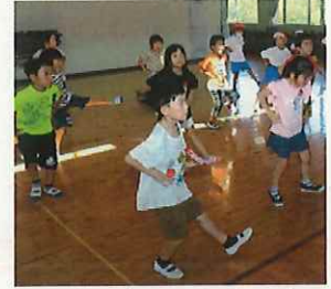
↑「ピカピカの1年生」ダンス