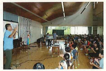
↑ 「月ことばの力はうれしいカ…月」