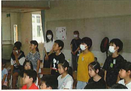
↑ 各クラス平和宣言をしました。