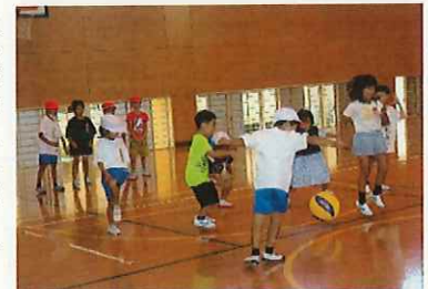
→転がしドッチボール