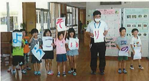
↑玄関で田野小、納所小の1年生をお迎えしました

1年生が、7月6日（木）に納所小、田野小の皆さんと交流活動を行いました。最初に、「ピカピカの1年生」のダンスをノリノリで踊りました。次に、一人一人が好きな物などを伝えながら自己紹介をしました。その後、「じゃんけん列車」「もうじゅう狩り」「リレー」「バナナおに」「転がしドッチボール」をして楽しみました。給食は、エアコンのある1年生教室で一緒に食べました。最後の感想交流で、納所小と田野小のお友達から「とても楽しかった」「また一緒にしたい」という感想がたくさん出ました。1学期の交流授業はこれで最後になります。2学期、一緒にバス旅行に行ったり、一緒に学習したりします。