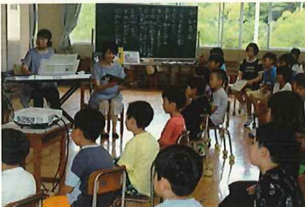
↑ 「となりのたぬき」の読み聞かせ