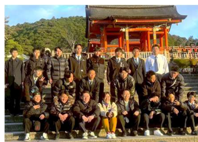
↑ 初日の京都での様子。

12月9日（火）～12日（金）まで、2年学年団が3泊4日で関西（京都・大阪・兵庫）へ修学旅行に行っていました。高校生活の中でも思い出に残るひと時になりました。