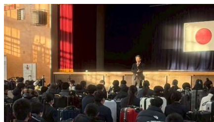
↑ 出発前の校長訓話の様子

↓ 3日目はUSJに行き、4日目は人と未来の防災センターや神戸の中華料理店に行きました。