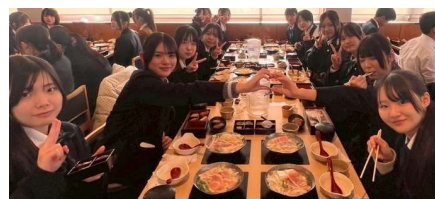
↑ 2日目は、嵐山での昼食の様子。