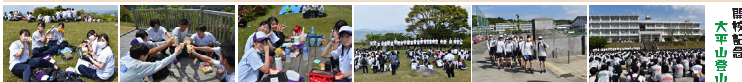
開校記念 大平山登山