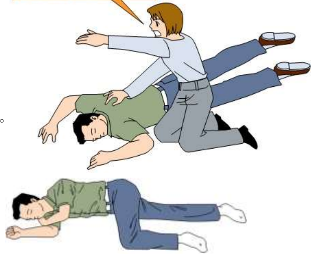
●回復体位のとらせ方