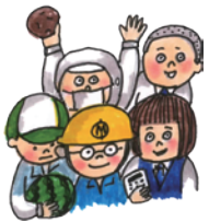
Chance Challenge Change II

ました。この3年で、伊万里実業高等学校は確実に変わっていることを実感した瞬間でした。新しい年度となり、また新たな伝統を後輩たちが引き継ごうとしています。「さらに発展する伊万里実業」を目指し、新たな未来へ向けて生徒達も様々なことに挑戦していくと思います。我々、職員も、両キャンパスが一つとなって、その後押しを精一杯やっていきたいと思えます。