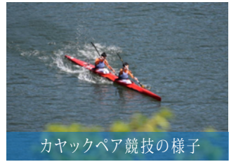
カヤックペア競技の様子