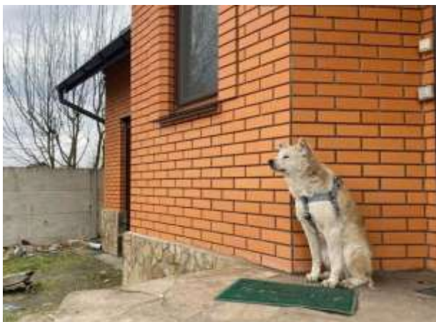
飼い主を待つ秋田犬の「リニ」