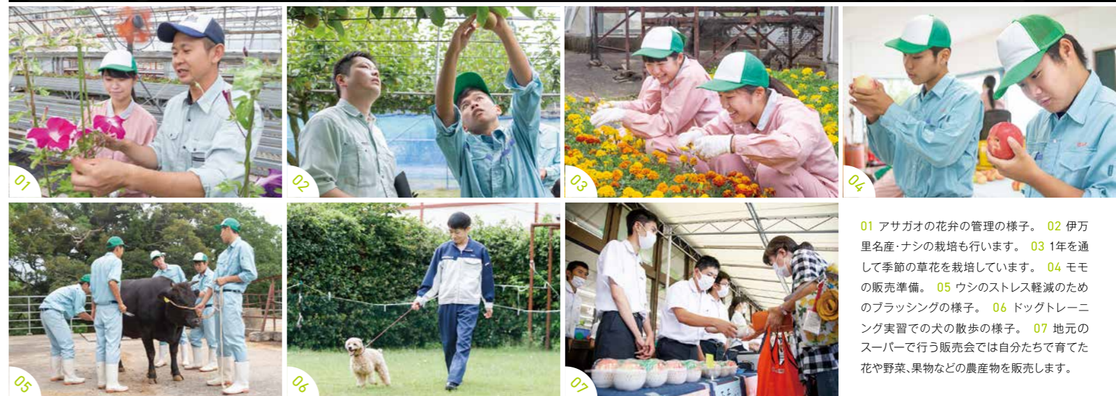
01 アサガオの花弁の管理の様子。 02 伊万里名産・ナシの栽培も行います。 03 1年を通して季節の草花を栽培しています。 04 モモの販売準備。 05 ウシのストレス軽減のためのブラッシングの様子。 06 ドッグトレーニング実習での犬の散歩の様子。 07 地元のスーパーで行う販売会では自分たちで育てた花や野菜、果物などの農産物を販売します。