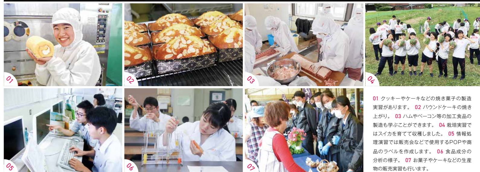
01 クッキーやケーキなどの焼き菓子の製造実習があります。02 バウンドケーキの焼き上がり。03 ハムやベーコン等の加工食品の製造も学ぶことができます。04 栽培実習ではスイカを育てて収穫しました。05 情報処理演習では販売会などで使用するPOPや商品のラベルを作成します。06 食品成分の分析の様子。07 お菓子やケーキなどの生産物の販売実習も行います。