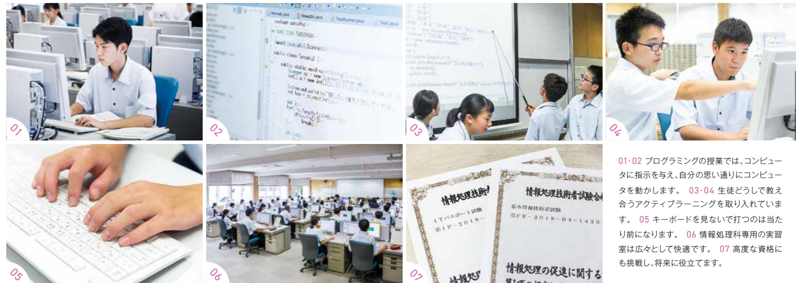
01-02 プログラミングの授業では、コンピュータに指示を与え、自分の思い通りにコンピュータを動かします。03-04 生徒どうして教え合うアクティブラーニングを取り入れています。05 キーボードを見ないで打つのは当たり前になります。06 情報処理科専用の実習室は広々として快適です。07 高度な資格にも挑戦し、将来に役立てます。