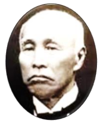
大隈重信 (1838~1922) 佐賀出身の傑物。君は「明治のイノベーター大隈重信」をもう視聴しましたか？大河ドラマでは大倉孝二さんが熱演中。

皆さんはまだまだ若い。失敗を恐れず何事にもチャレンジして欲しい。失敗しても、そこから学び、さらに成長して起き上がる。そんな頼もしさが欲しい。