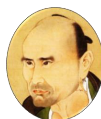
佐藤一斎 (1772~1859) 幕末の人材を育てた儒学者。『言志四録』はリーダーのバイブルで西郷隆盛の愛読書と言われている。

図書館に池田勇太著『福澤諭吉と大隈重信 洋学書生の幕末維新』（山川出版社）が所蔵されています。興味のある方はご覧ください。