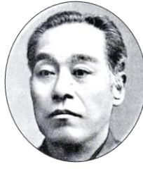
福澤諭吉 (1835~1901) 大分出身の偉人。大阪の適々齋塾で学び、のちに江戸で慶應義塾を創立。1984~現在年まで1万円札でお馴染み。

図書館に池田勇太著『福澤諭吉と大隈重信 洋学書生の幕末維新』（山川出版社）が所蔵されています。興味のある方はご覧ください。