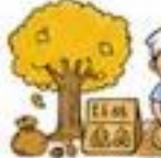
ざんなんの収穫、販売